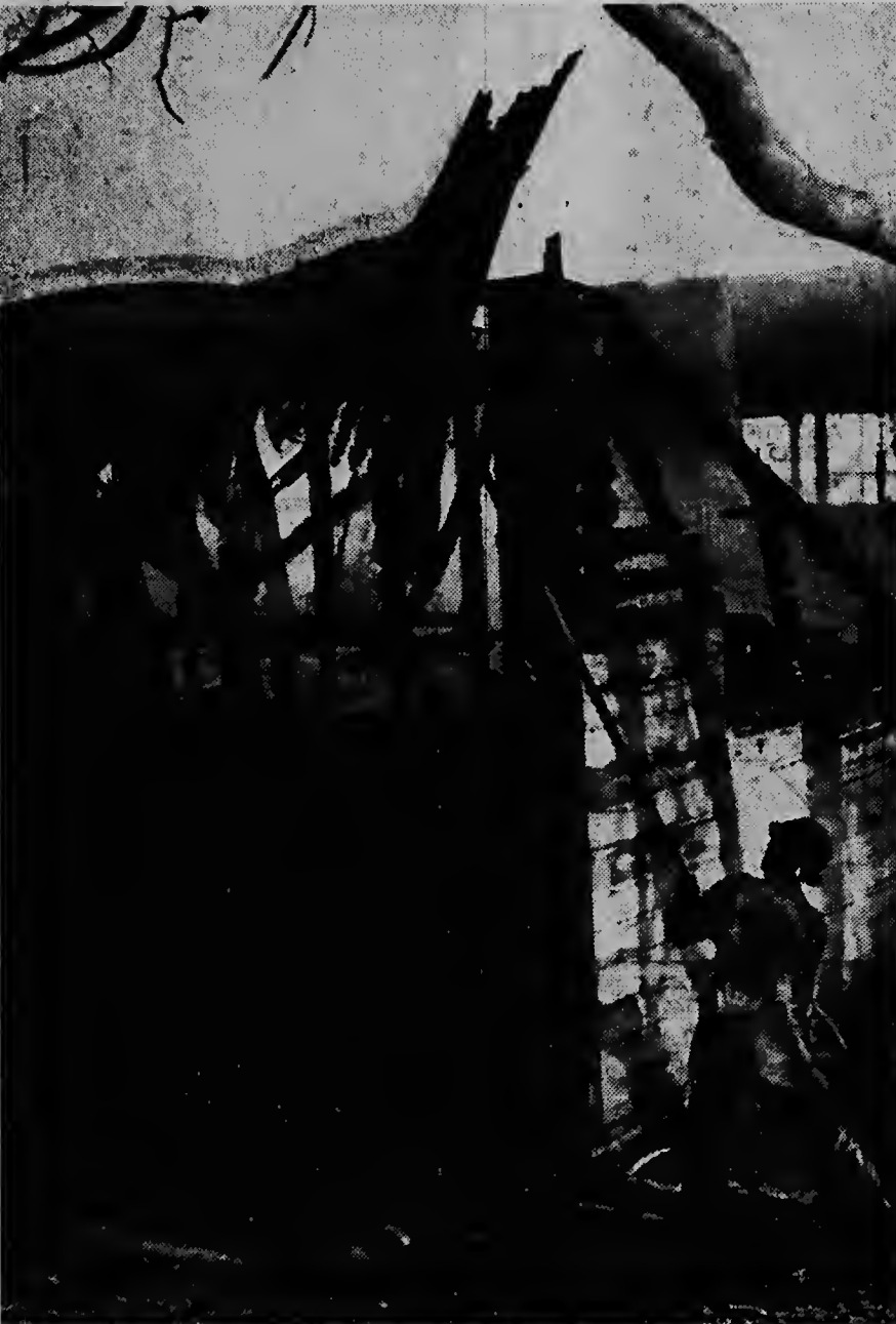
Brandweer tabata ajera mainta masha rapido na e luga di calamidad pa trata na salba dje loads loque cu por a salba ainda.

Cosme Damina Bikke, di Hooiberg 79 a perde un cartera di cuero conteniendo fls. 18.— un cheque di fls. 1000.—. El a perde e cartera den vecindario di Oranjestad.